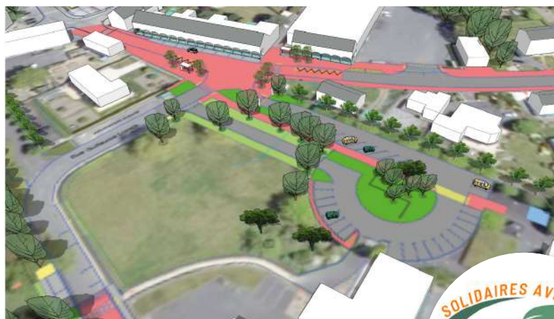
Zone commerciale et école maternelle Martin-Luther-King

Durant toute la durée des travaux, l'accès piétons aux commerces sera sécurisé. De plus, les accès livraison et le parking du supermarché resteront accessibles.