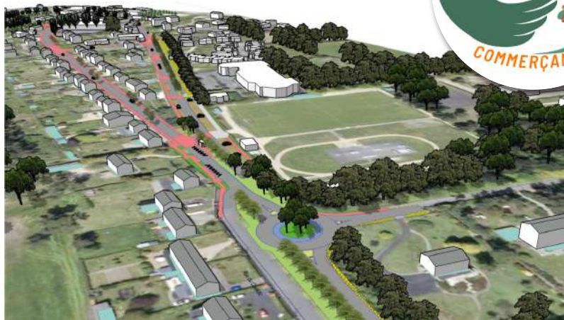
Carrefour rue de la Gare-D109 et rue Koad Pin